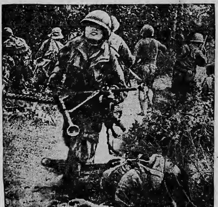
PARATROOPERS van de Franse strijdkrachten zijn er in geslaagd een door de vijand van de hoofdmacht afgesneden batalion uit zijn omsingeling te verlossen. Intussen blijven de berichten uit Indo China zeer verward en wijst alles er op, dat de Fransen zich voor een zeer bedenkelijke crisis geplaatst zien.